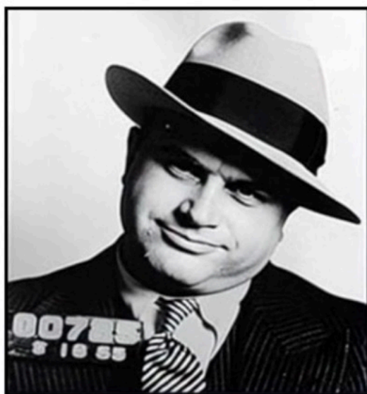
- Gangsterboss Joe Dogs (Fahndungsfoto rek.) -

Das Gericht: Übergroße Kugeln aus bestem Rindfleisch, vollgepackt mit Knoblauch, Kräutern und Käse. Frittiert bis zur Kruste, dann geschmort in einer samtigen Tomatensauce, unsere Interpretation der Sinatra-Sauce: knoblauchlastig, zwiebelsüß, tomatensamtig. Serviert unter einer importierten Burrata aus Apulien, dem heiligen Zentrum der Burrata-Herstellung. Jeder Bissen eine zarte Explosion, die deine Diätpläne auslacht.