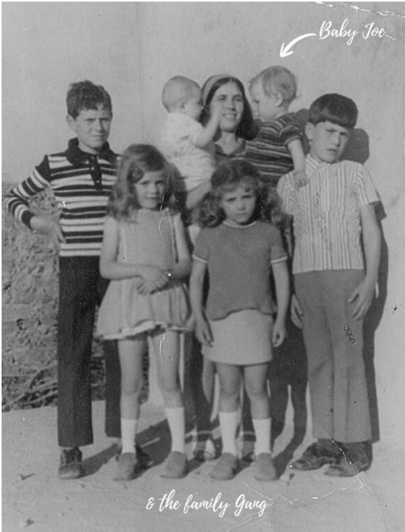
- Familienfoto des Autors ca. 1973