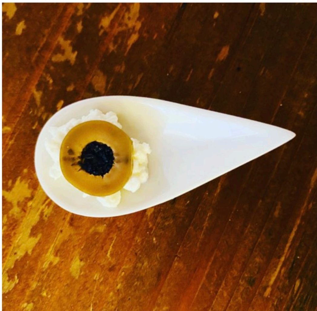
- Amuse-Bouche, das Auge der Sphinx -